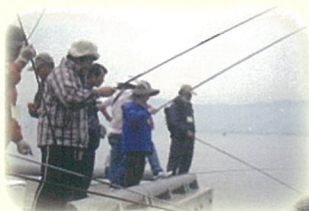
ボランティアの日