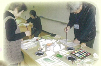
地域活動体験学習