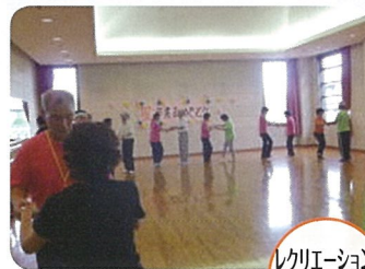
レクリエーションダンス