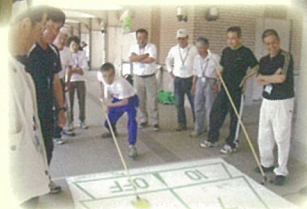
ニュースポーツ大会