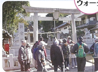
フォト・ウォーク