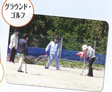
グラウンド・ゴルフ