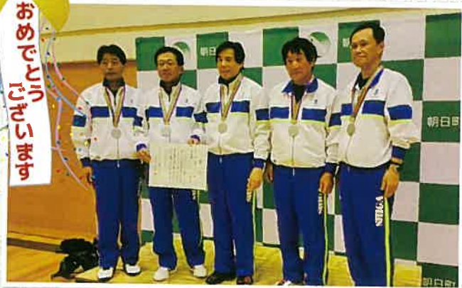
▲準優勝されたビーチボールの滋賀県選手の皆さん チームワークの良さで、準優勝という良い結果が残せました。ありがとうございました。 また、大会出場に際しまして、ご協力とご支援をいただきました関係者の皆様に、心より感謝申し上げます。