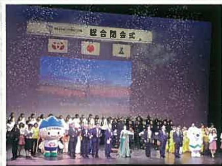
▲総合閉会式(富山市芸術文化ホール) 富山に伝わる代表的な民謡「越中おわら」の披露、地域の合唱団が「ふるさとの空」など富山の美しい歌をうたい、大会のフィナーレを飾りました。

今年(2019年)は、「あふれる情熱 はじける笑顔」をテーマに、2019年11月9日(土)~12日(火)和歌山県で「ねんりんピック」が開催されます。滋賀県選手団として参加して、楽しみませんか!