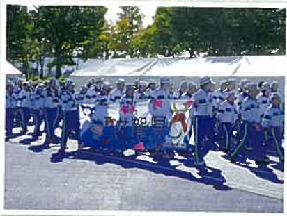
▲開会式に向かう滋賀県選手団 晴天に恵まれ、美しい立山連峰が見渡せる富山県総合運動公園陸上競技場で開会式が行われました。

◆ 昨年は、平成30年11月3日(土)から6日(火)までの4日間“夢つなく 長寿のかがやき 富山から”をテーマに、スポーツ交流大会10種目、ふれあいスポーツ交流大会12種目、文化交流大会5種目が開催されました。富山県の各会場では、地域の特徴を活かしたおもてなしがありました。