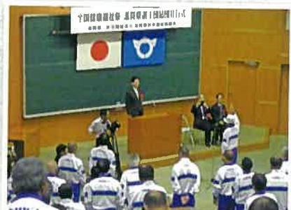
▲大会前に結団式を開催 (滋賀県立長寿社会福祉センターにて)