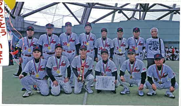
▲優勝されたソフトボールの滋賀県選手の皆さん 2～3年前からチーム力が上昇してきた手ごたえがあったので、今年のねんりんピックは全国優勝を目標に設定していました。全国優勝という高い目標が達成できて、やりがいがありました。今後に向けてQOL向上を感じています。