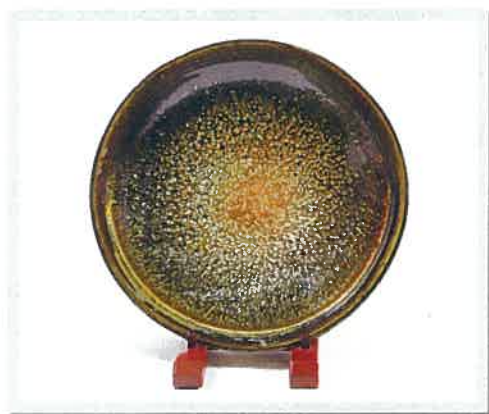
花火 佃 豊和(部門:工芸) ねんりんピック和歌山2019美術展 銀賞