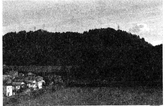
川辺地区南端に位置する灰塚山と灰塚池 灰塚山の山腹、山裾には古墳が複数の古墳が営まれた。また山裾からは栗東市最古の考古遺物が出土している。

古代から中世にかけては地区中央部の平坦地に集落が形成されていましたが、江戸時代になると東海道に沿って集落が営まれ、中世までの集落は田地へと姿を変えたようです。