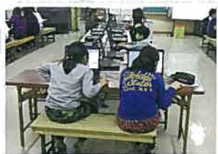
▲大津市立真野北小学校のパソコン教室を支援

近所の小学校だったということもあって、参加するようになりました。大津支部では以前から小学校の支援活動を行っていて、校長先生から「もっと他にも活動してほしい。」という嬉しい要望がありパソコン教室や、レイカディア大学の園芸学科で培った技術を活かして大津市立真野北小学校の卒業式、入学式花鉢飾り活動などを始めました。