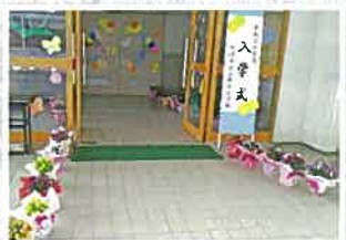
▲大津市立真野北小学校の卒業式・入学式花鉢飾り活動