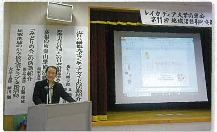
▲レイカディア大学の卒業生が行っている地域活動事例発表会の様子