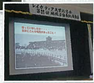
民具以外にも昔懐かしの草津駅▶周辺の写真を紹介する場面も。「草津に競馬場があって、そこで切符売りしていたよ！」と話す方も。