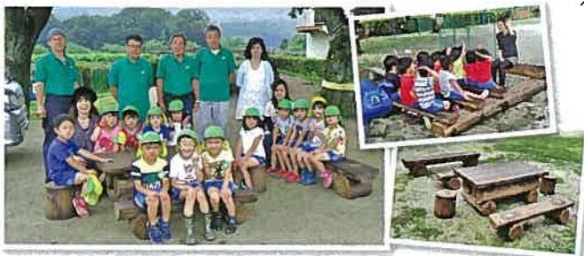
▲テーブルセットやベンチに座っている子どもたちの様子