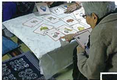
◀民具かるたを使って、楽しんでいる様子

また、メンバーも募集しています。地域の「貴重な宝である民具」を継承し、暮らしと歩みを子どもたちに語り継いでいく活動、民具を通じて、懐かしい思い出に寄り添い高齢者の方々と楽しいひと時を一緒に過ごしませんか？