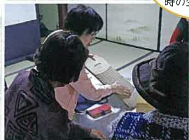
▲サロンでの活動の様子：メンバーの皆さんが懐かしの民具を紹介。洗濯板を見た方は、「懐かしなあ～昔はこれで洗濯していたあ～」と振り返る。