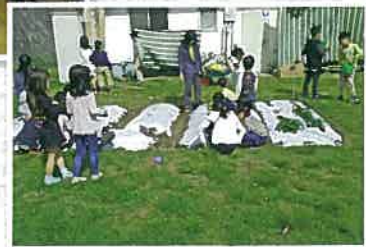
大津市立真野北児童 クラブの畑支援活動