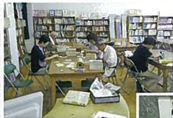
◀大津市立真野小学校の 図書整理活動の様子

皆さん、レイカディア大学に入学して、同窓会大津支部にぜひ全員入会してください！お待ちしております！一緒に楽しく活動しましょう！！